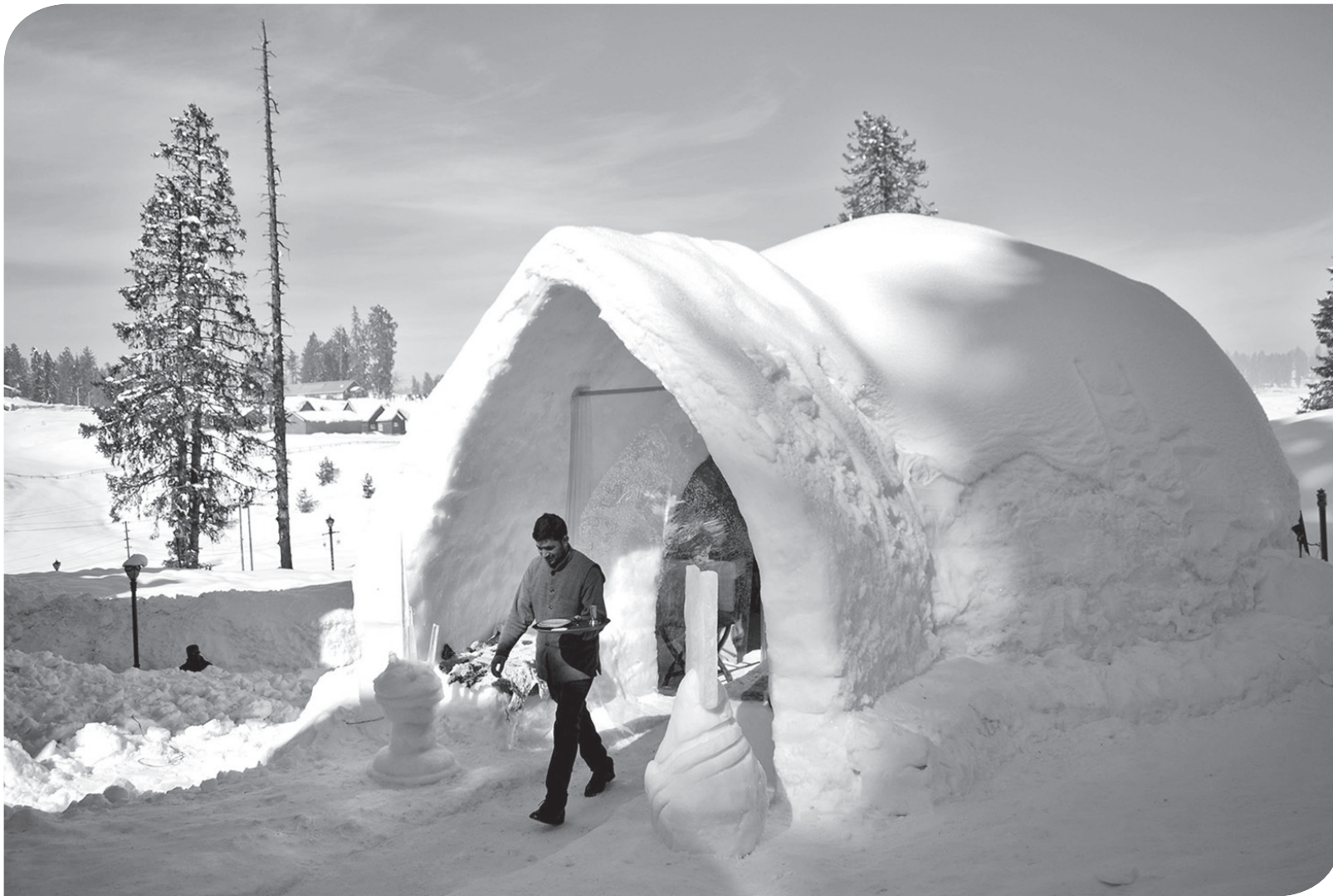
KAFE DARI SALJU DAN ES DI INDIA